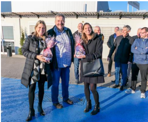
Besuch bei AMAC Aerospace