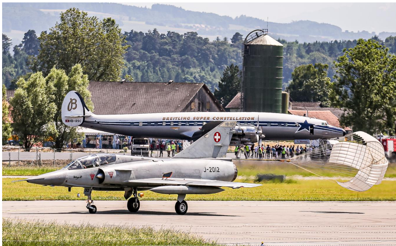
Bald Geschichte: Am 25.05.2023 wird die Mirage III DS HB-RDF ihre beiden letzten Flüge durchführen. Etwas früher, als eigentlich geplant... Die Schweizer Super Connie ist schon Geschichte...