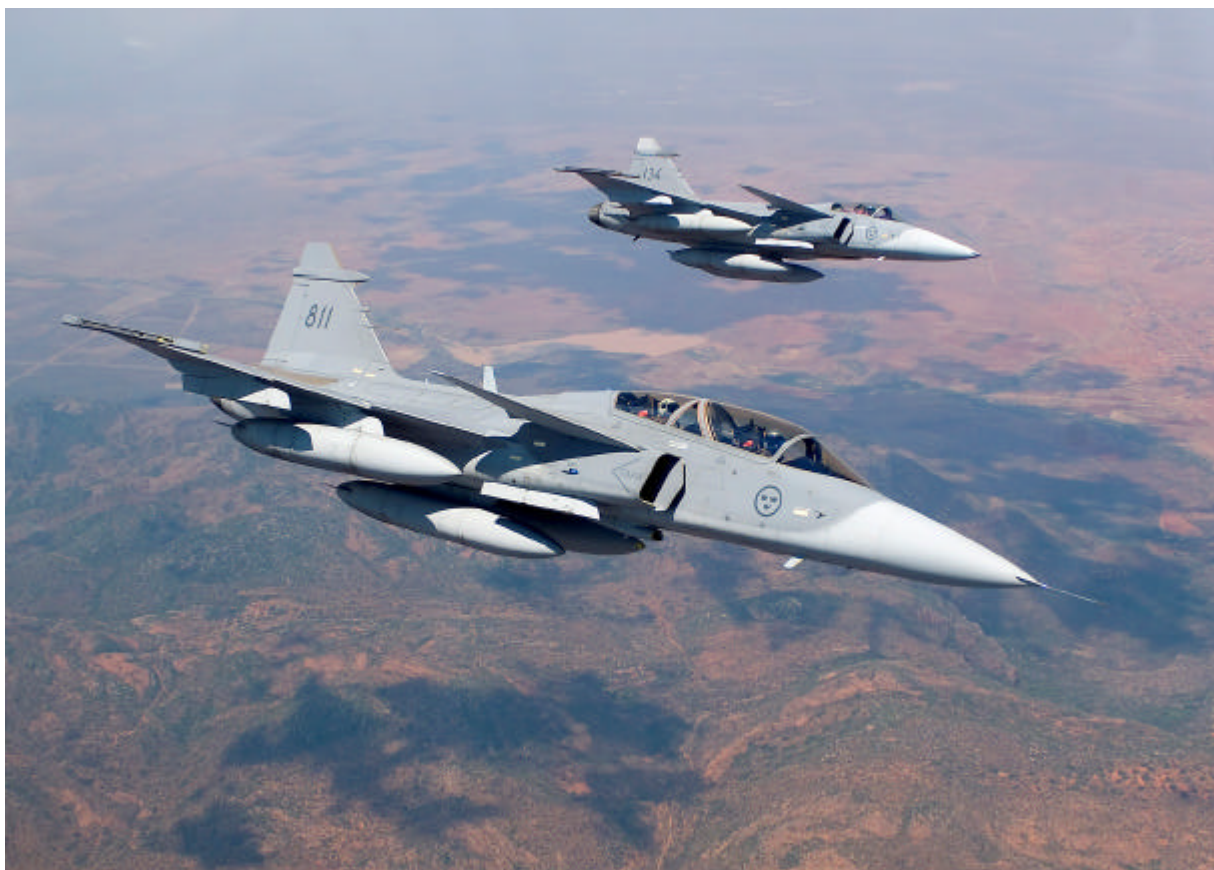
JAS-39A / JAS-39C Gripen Swedish AF