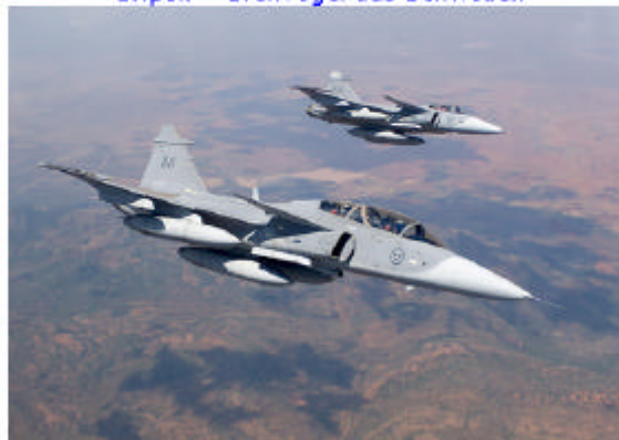
JA5-39A / JA5-39C Gripen / Swedish Air Force Weitere Fotos in der Gallery

Donnerstag 23.02.2006 / 2000 Uhr Gripen – Greifvogel aus Schweden