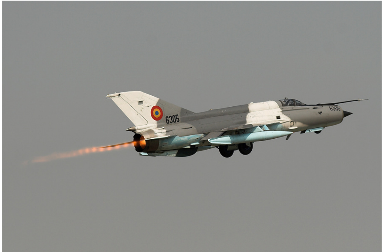
MiG-21 Lancer-C Rumänische Luftwaffe Fetesti 30.07.2006