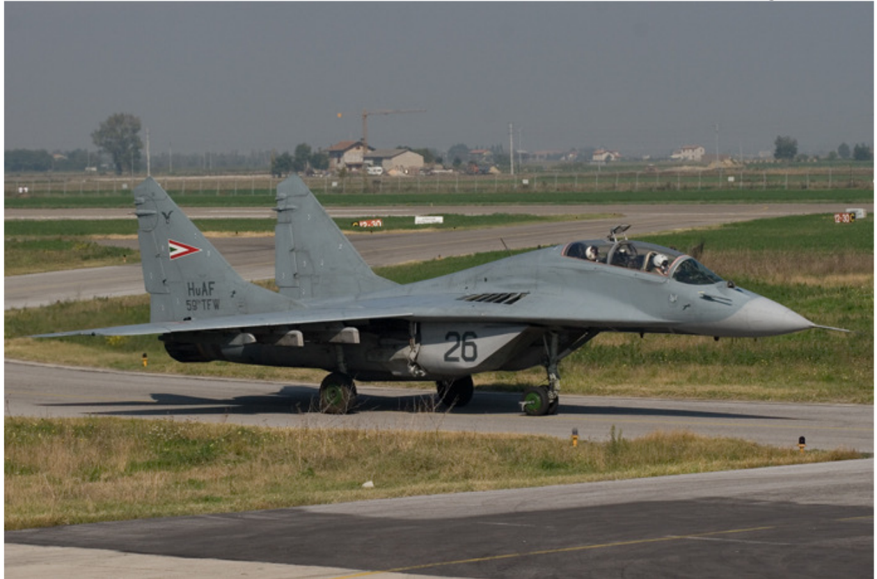
MiG-29UB Fulcrum HUAF Cervia 10.10.2006