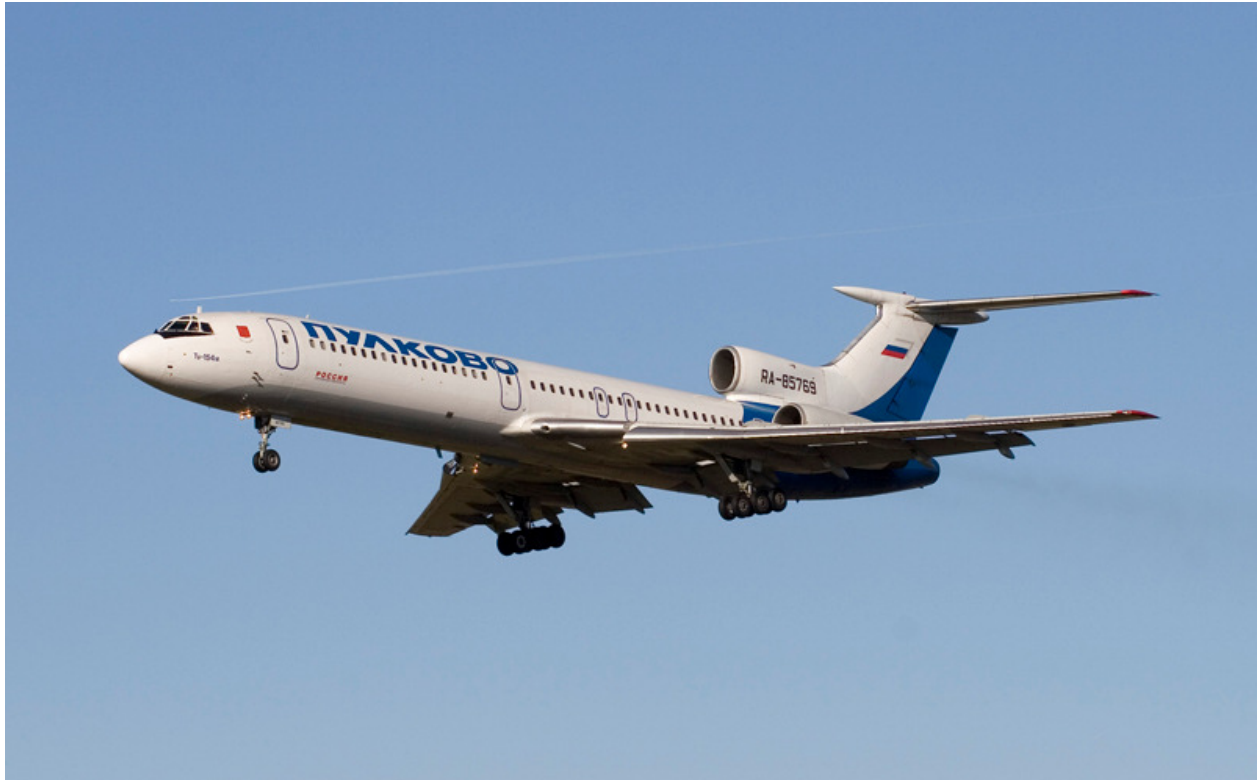
Tupolev Tu-154M Pulkovo Genf 13.01.2007