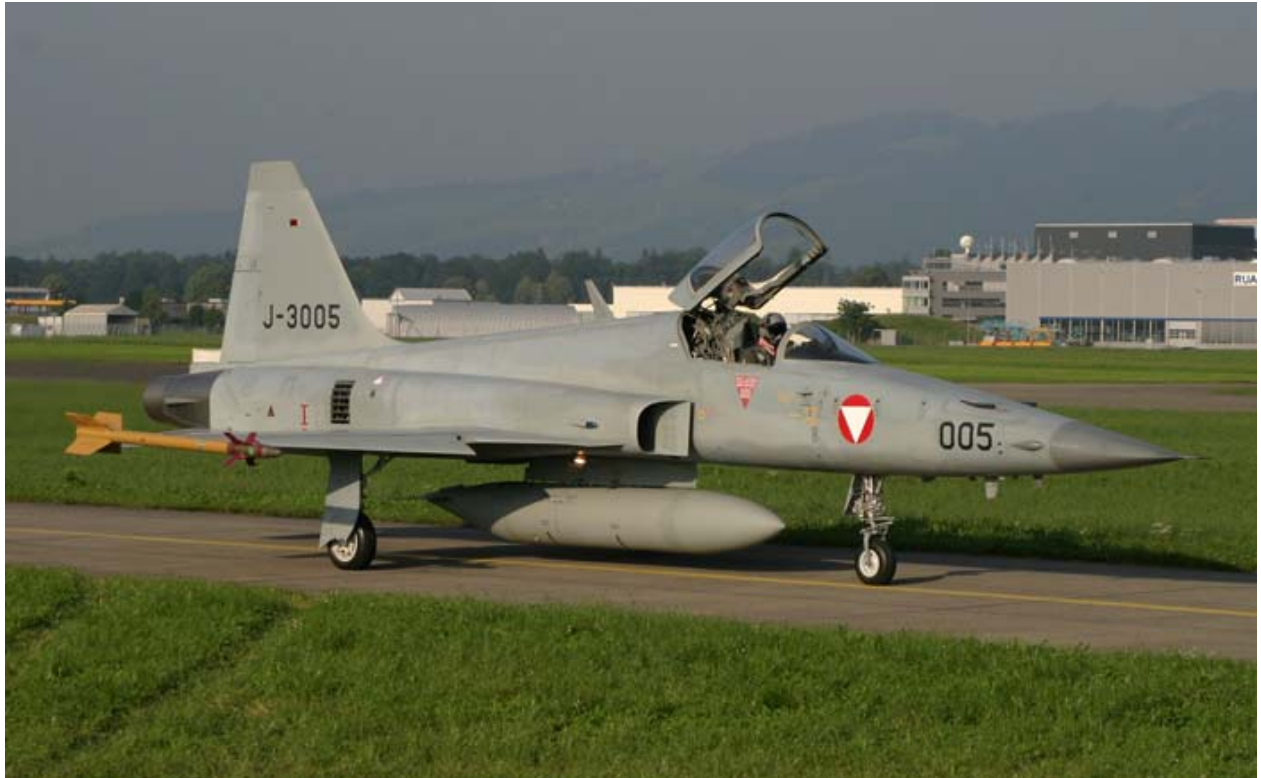
Northrop F-5E Tiger II J-3005 Emmen 7.7.2004