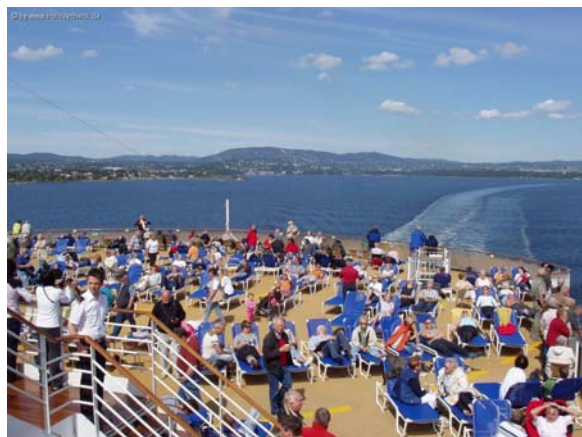
Sonnendeck im Oslofjord